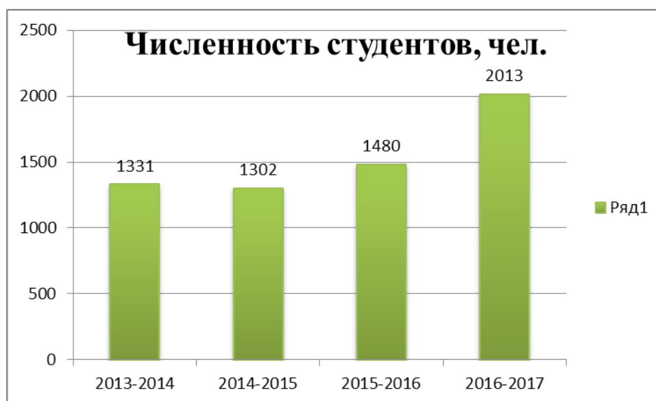
Таблица 3 - Динамика контингента обучающихся по программам ВО и СПО

Контроль уровня усвоения студентами учебно-программного материала по основным дисциплинам гуманитарного, общепрофессионального и специального циклов осуществляется следующими способами: тестовый контроль, устный опрос, контрольные работы, лабораторные работы, комбинированный контроль, интернет - тестирование и др.