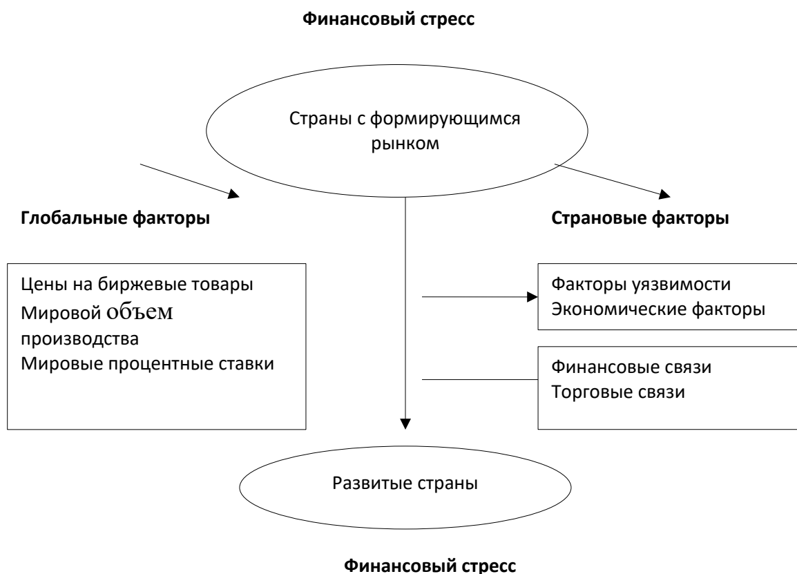
Рисунок 1.2 – Передача воздействия финансового стресса в мировой экономике [16, с.145]