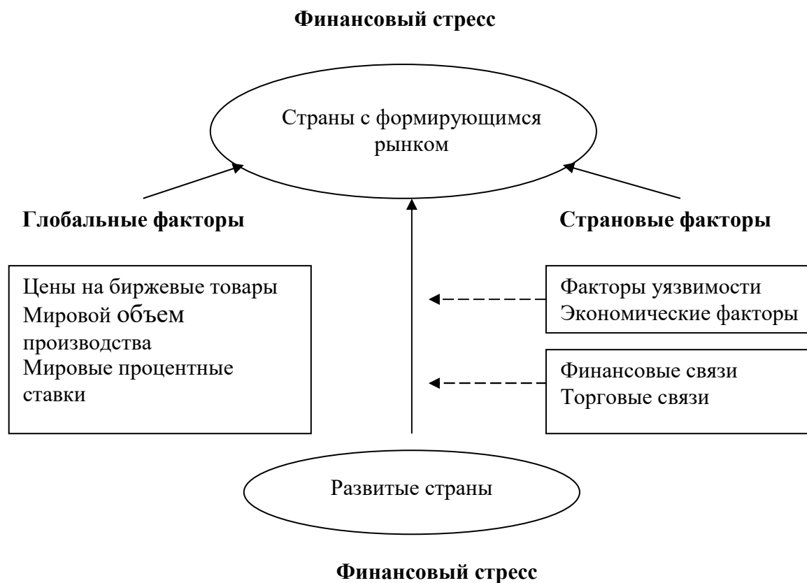
Рисунок 1.2 – Передача воздействия финансового стресса в мировой экономике [16, с.145]